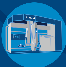
DeLaval VMS™ Serie